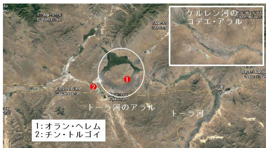
図2 トーラ河のアラル

戦いの後、甲軍はアラル（島）付近に駐屯したと集史にある。その島は下図の白丸で囲った部分であろう。有名なケルレン河のCODEE・アラルと同じように、トーラ河の本流と分流とで周囲を完全に囲まれた島と言える土地である。正にそこにオラン・ヘレム、本稿でアラン塞と推定した遺跡がある。即ち、乙軍を打ち破った後、輜重を置いていた所に甲軍は戻ってきたと集史は述べているのである。島といっても日本のように豊富な水のある河が取り巻いているわけではないが、冬の凍上で谷地坊主が出来て足場の悪い土地なのであろう。外部からの取り付きが良くない事も防御力をたかめるので要塞を設置する理由になったと考えられる。集史の記述は全体として見れば誤りだが、アラルに帰ったという部分は正しかったことになる。地図を見るとオラン・ヘレムの東 2.5km ほどの所の、河の真ん中にも同じような形の城跡のような物が見える。何であろうか。