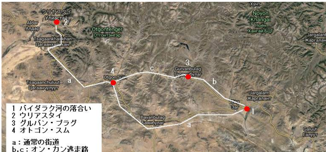
図2 テムジンとオン・カンの撤退経路

ペルレーはこの河をバイダラク河北東のハル・スール河としている。下図の1の地点がバイダラクの落合だが、そこから北東に進むとハンガイ山脈の中に入り込んでしまい、帰路を目指すウリアスタイに向かうのが困難である。この方向に進んだとは思えない。考えられるのは、bでグルバン・ブラグ方面を目指す事である。現在の地図にはここまでしか道路表示がないが、その先のオトゴン・スムまで行けそうな河が続いている。cの経路にある河が、カラ・セウル河ではなかろうか。